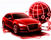
DoIP Diagnóstico via Internet